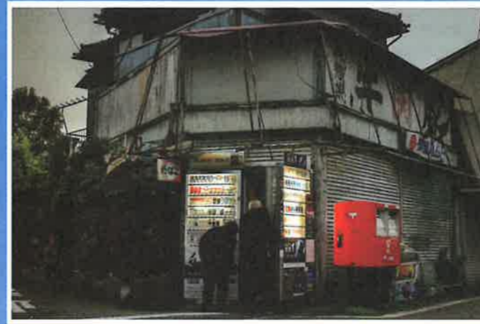
文部科学大臣賞・JPA大賞「廃業」 漆原 勝造