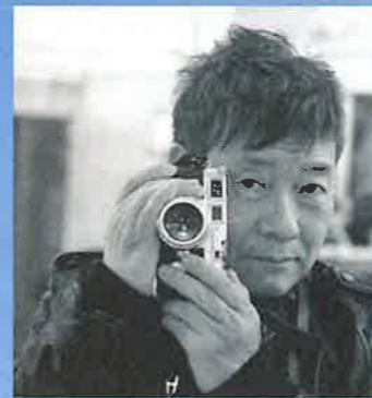
写真家 ハービー・山口